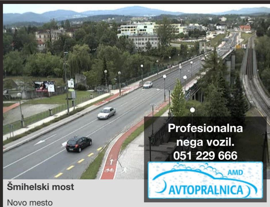
Šmihelski most Novo mesto