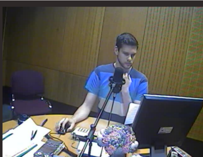
STUDIO Radio Krka

Prijava z Facebook-om » Klasična prijava » Registracija