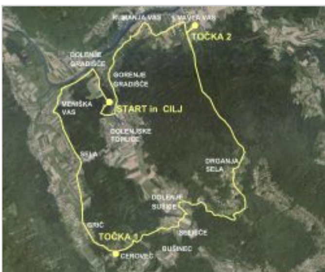
Trasa sobotnega dobrodelnega kolesarjenja.

Dolenjske Toplice - Kolesa sreče – tako so Rotary klub Dolenjske Toplice, Servis in prodaja koles Štangelj ter Društvo Sonshine – Evropski center za obravnavo avtizma poimenovali kolesarski izlet z dobrodelnim namenom, ki ga po okolici Dolenjskih Toplic pripravljajo v soboto, 31. maja. Druženje v naravi, ki se bo začelo ob 8.15, bodo nagradili z osveščanjem o avtizmu, zbran denar pa namenili za pomoč družinam, ki živijo z avtizmom.